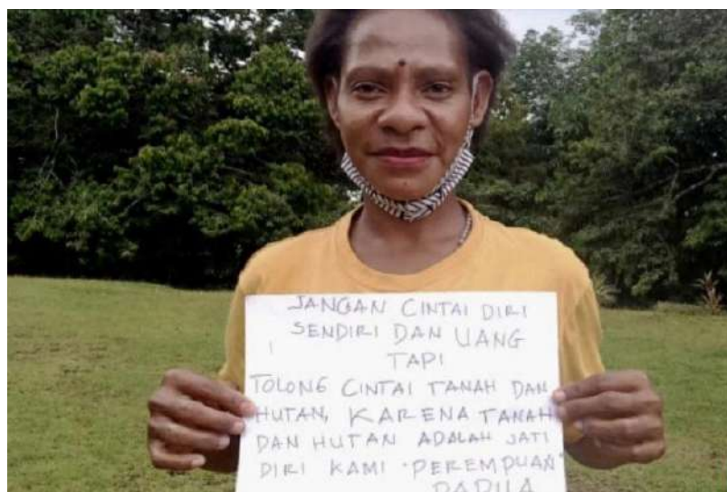
Perempuan Papua dan perjuangan mempertahankan ruang hidup mereka.

Ekspansi sawit tidak lepas dari wacana krisis energi yang mendorong ketersediaan sumber-sumber energi terbarukan. Sawit dilihat sebagai satu bahan dasar energi terbarukan. Di Indonesia, wacana ini didukung dengan terbitnya kebijakan omnibus law untuk mengengjot investasi.