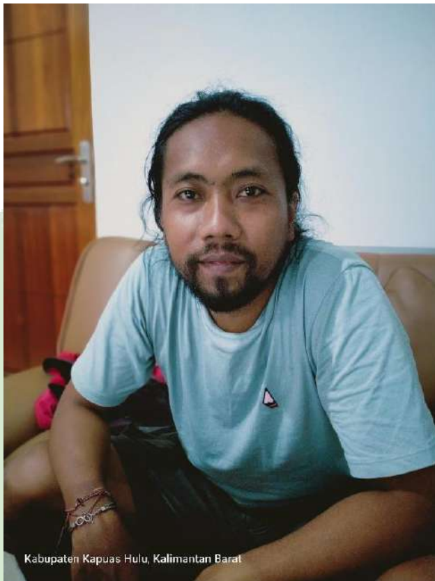
Kabupaten Kapuas Hulu, Kalimantan Barat