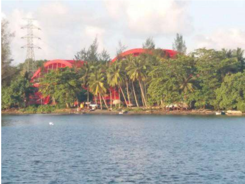
Sisi Luar Hutan Perempuan di Kampung Enggros, Jayapura.

Tidak banyak komunitas memberi ruang pada perempuan, apalagi dalam budaya Papua yang masih sangat patriarkhi. Termasuk hutan di banyak suku dianggap sebagai pekerjaan di ranah publik sehingga hanya dilakukan oleh laki-laki. Hanya di kampung Enggros, perempuan memiliki hutan yang dikhususkan bagi mereka. Sayangnya sejarah panjang pembangunan berkelanjutan telah menggerus eksistensi hutan ini.