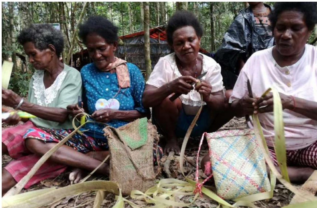
Foto utama: Ilustrasi. Perempuan Papua, berjuang mempertahankan hutan adat dan berjuang mendapatkan hak atas tanah.