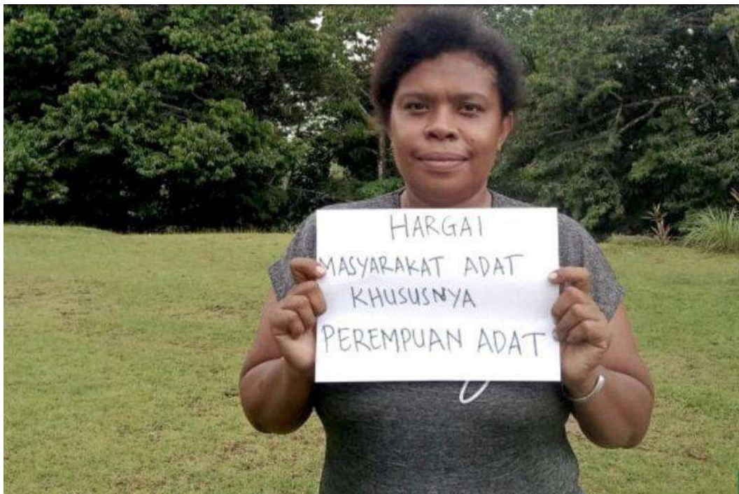
Suara Perempuan Papua.

Rasella bilang, negara saat pada posisi menjadi fasilitator pasar bebas. Melalui kebijakan, negara membuka keran investasi asing seluas-luasnya, menghilangkan regulasi penghambat, dan mempermudah apapun yang selama ini dirasa menyulitkan.