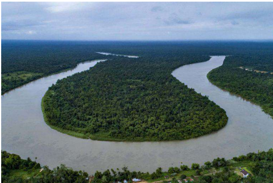
Hutan Papua yang terus terancam.

“Seperti apa kita bisa menempatkan perempuan dalam arena pengaturan sumber daya alam ini. Apakah karena mereka tidak punya hak milik maka mereka tidak berhak? Mungkin tidak seperti itu. Masyarakat adat, sudah mulai melihat, perempuan punya posisi penting. Mereka percaya, adat menghormati perempuan.”