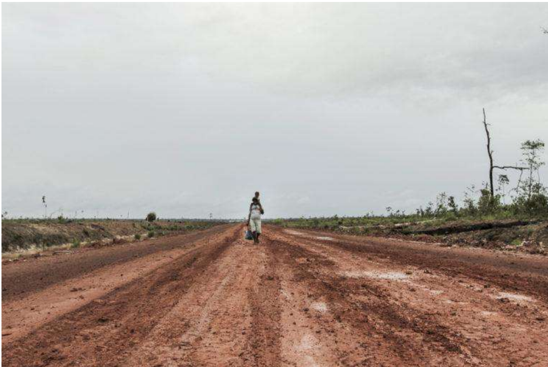
Hamparan tanah sudah bersih, yang sebelumnya hutan adat Malind Anim di Desa Zanegi, Merauke, Papua.

Membongkar kembali cara pandang seperti itu, katanya, bisa jadi langkah awal dalam bergerak melawan eksplotasi dan laju perampasan lahan yang banyak terjadi di Tanah Papua.