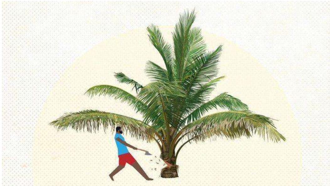
Ilustrasi Masyarakat Adat Moi. tirto.id/Lugas

Di antara terampasnya ruang hidup masyarakat adat suku Moi oleh perusahaan kelapa sawit, mereka tak menjadi prioritas vaksinasi Covid-19.